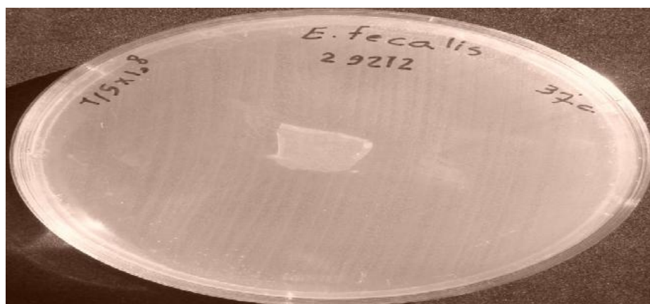
تصویر ۳- عدم رویت هاله‌ی عدم رشد در انتروکوکوس فکالیس (ATCC25922)