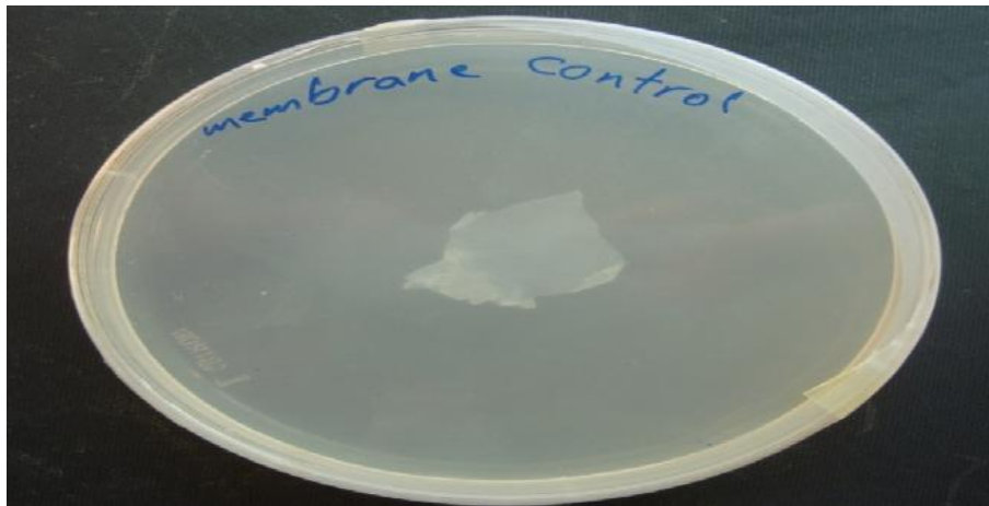
تصویر ۴- کنترل غشاء آمینوتیک از نظر عدم آلودگی