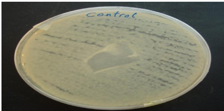
تصویر ۵- کنترل منفی توسط غشاء نیتروسلولزی کلنی‌های باکتریایی در سراسر محیط کشت حتی در زیر غشای نیتروسلولزی مشاهده می‌گردند.