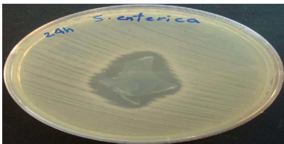
تصویر ۱- هاله‌ی عدم رشد توسط غشای آمینوتیک بر روی سالمونلا انتریکا (ATCC29212) به قطر میانگین 63mm مشاهده می‌گردد.