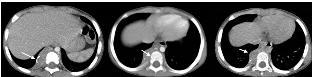
شکل ۳. سی‌تی‌اسکن اسپیرال شکم و قفسه سینه با تزریق کنتراست (برش‌های اکسیال) در پنجره‌های مدیاستینال و استخوانی. توده پاراورتبرال راست در مجاورت مهره‌های خلفی همراه با کلسیفیکاسیون و شواهد درگیری استخوانی مشاهده می‌شود. (فلش‌ها)

ارزیابی‌های بیشتر شامل اسکن استخوانی، آزمایش آزادسازی گاما اینترفرون (IGRA) از نظر بررسی سل، اندازه‌گیری سطح وانیلین مندیلیک اسید (VMA) ادراری، بررسی پروفایل ایمنی از جهت رد نقص ایمنی و سی‌تی‌اسکن شکم و لگن بود. اسکن استخوان افزایش جذب در چندین ناحیه اسکلتی را نشان داد که شک به بدخیمی خونی را افزایش داد. IGRA منفی گزارش شد. VMA ادراری ۱ میکروگرم در ۲۴ ساعت (در محدوده طبیعی) بود. بررسی پروفایل ایمنی طبیعی بود. جهت بیمار آسپیراسیون مغز استخوان انجام گرفت که نمونه