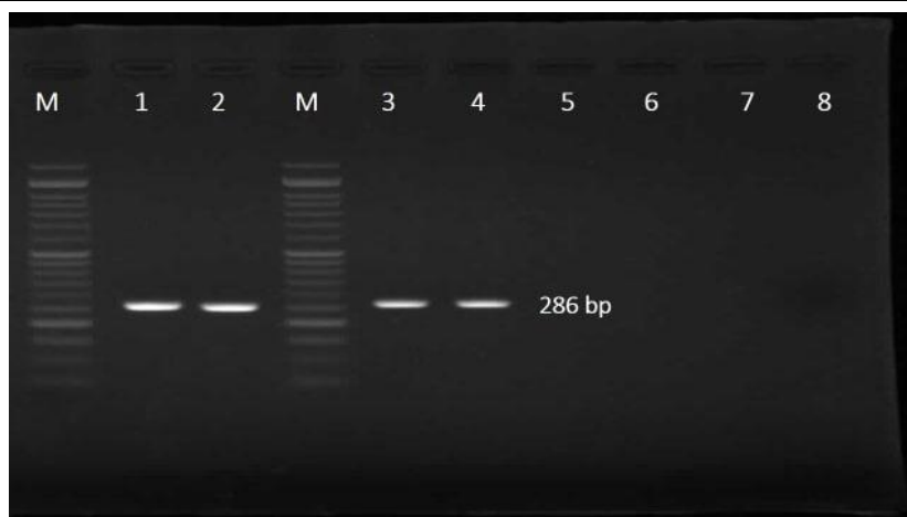
شکل ۲. الکتروفورز محصول PCR روی ژل آگارز. M DNA: سایز مارکر ۵۰ جفت بازی، ستون ۱: نمونه کنترل مثبت ژن mecA

مقاومت استفاده شد و کلیه آزمون‌های فوق چهار نوبت تکرار شدند. برای تهیه نمونه شاهد، ۴۵۰ میکرو لیتر ( \mu\text{l} ) از محلول بالاترین غلظت نمکی (۲ گرم درصد) را با ۵۰ میکرو لیتر ( \mu\text{l} ) سوسپانسیون باکتری تهیه شده مخلوط گردید و ۱۰۰ میکرو لیتر ( \mu\text{l} ) از آن به پلیت مولر هیتون آگار تلقیح شد همچنین ۴۵۰ میکرو لیتر ( \mu\text{l} ) از الکل ۷۰ درصد به عنوان کنترل مثبت با ۵۰ میکرو لیتر سوسپانسیون باکتری تهیه شده مخلوط گردید و پس از ۵ دقیقه ۱۰۰ میکرو لیتر از آن به پلیت مولر هیتون آگار منتقل شد. با رقیق‌سازی مواد و بررسی رقت‌های مختلف چهار محلول Mixed Oxidant، حداقل غلظتی که از رشد باکتری جلوگیری می‌کند (MIC) مورد بررسی قرار گرفت. محاسبه MIC به روش رقت‌های متوالی (Serial Dilution) انجام گرفت. به این ترتیب که از محلول‌های Mixed Oxidant مورد نظر در لوله‌های متوالی غلظت‌های متوالی تهیه و سپس غلظت‌های متفاوت بر باکتری تأثیر داده شد و حداقل غلظت مهارکنندگی محاسبه گردید. از محلول‌های Mixed Oxidant مورد بررسی با روش رقت‌های متوالی (Serial Dilution) در لوله‌های متفاوت، رقت‌های ۱، ۱:۲، ۱:۴، ۱:۸ از چهار محلول Mixed Oxidant تهیه شد و در ادامه طبق روش انتخاب شده اول بر اساس استاندارد اروپایی (EN