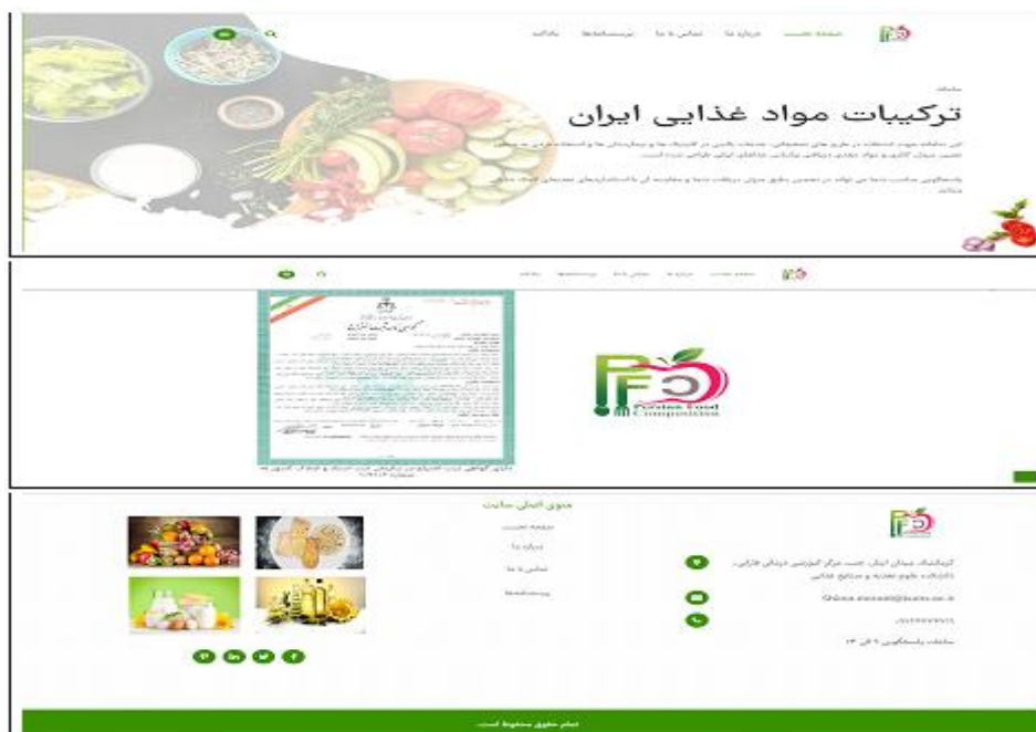
شکل ۱: نمای صفحه اصلی سامانه ترکیبات مواد غذایی ایران

یافته‌های مطالعه حاضر منجر به طراحی سامانه ترکیبات مواد غذایی ایران به آدرس https://persianfc.ir شد که