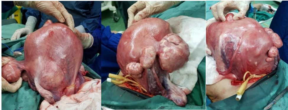
تصویر ۱. نمای قدامی و لترال رحم بعد از باز کردن شکم در بیمار اول

مختلف رحم وجود داشت. تعداد میوم ها بیشتر از تعداد ذکر شده در سونوگرافی بود. قبل از عمل میزوپروستول رکتال تجویز شده و قبل از برش بر روی رحم جهت کاهش حجم خونریزی از سوند فولی به عنوان تورنیکت در ناحیه ایسم استفاده شد. سپس با دو برش طولی در خلف و قدام رحم، دسترسی به کلیه میوم ها امکانپذیر شد. تعداد ۵۷ میوم خارج شد. در طی جراحی بیمار ترانزاگزامیک اسید و ۳ واحد خون دریافت نمود (تصویر ۱). پس از خارج کردن میوم های متعدد، رحم با نخ ویکریل یک و صفر در چندین لایه ترمیم شده و با نخ ۳-۰ سرورز ترمیم گردید. نکته حائز اهمیت در این بیمار خروج تمام میوم ها از دو برش، باز نشدن کاویته رحم و حفظ وضعیت آناتومیک طبیعی رحم پس از خارج سازی میوم های متعدد بود.