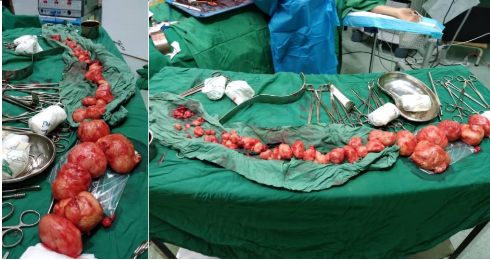
تصویر ۳. میوم های متعدد خارج شده از رحم بیمار دوم