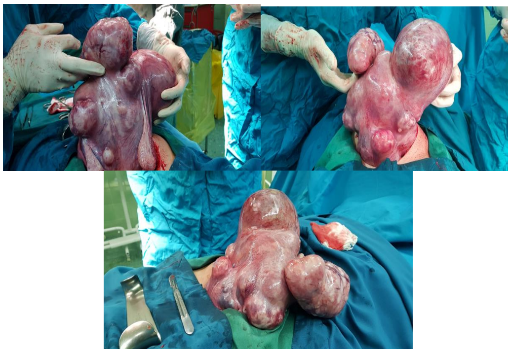
تصویر ۲ نمای قدامی، لترال و خلفی رحم بعد از باز کردن شکم در بیمار دوم

پاتولوژی در هر دو بیمار لیومیومای conventional را گزارش نمود. بیماران بجز خونریزی حین عمل و نیاز به تزریق خون هیچ عارضه ای در طی جراحی و پس از آن نداشتند. پس از انجام مراقبت های بعد از عمل، ۴ روز بعد از جراحی با حال عمومی خوب از بیمارستان ترخیص شدند. پس از گذشت یک ماه از انجام عمل جراحی خونریزی غیر طبیعی و کلیه مشکلات گوارشی و ادراری بیماران رفع شده بود. در ارزیابی سونوگرافی سه ماه بعد، رحم طبیعی و ۳ عدد میوم کمتر از یک سانتیمتر مشاهده شد و بیمار مشکل خاصی نداشت.