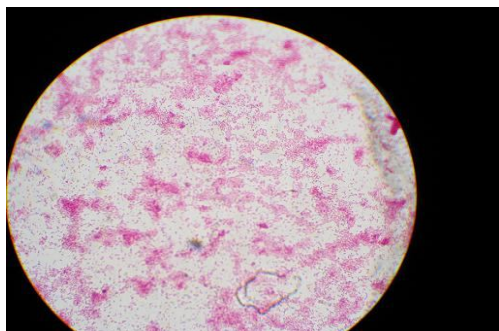
شکل ۲: رنگ آمیزی گرم باکتریهای جدا شده

نتایج تستهای تأییدی: پس از گذشت ۱۰ روز از کشت نمونه‌های خون، کلونی‌های مشکوک به بروسلا مشاهده شدند (شکل ۱). پس از انجام رنگ آمیزی گرم و مثبت شدن تست‌های کاتالاز، اکسیداز و اوره آز باکتریهای بروسلا جدا سازی شدند (شکل ۲).