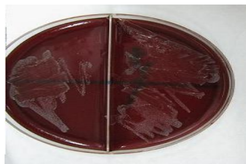
شکل ۱: کلونی باکتریهای جدا شده روی محیط کشت بروسلا آگار خون دار

تست مقاومت به رنگ (Dye Tolerance Test): از کشت ۷۲ ساعته هر باکتری جدا شده یک رقت ۰/۵ مک فارلند تهیه شده و به میزان ۱۰ میکرولیتر برای هر پلیت در یک ست ۶ تایی از محیط‌های مقاومت به رنگ تلقیح شد. هر ست دارای ۳ پلیت حاوی BHI آگار و رقت‌هایی از رنگ تایونین به میزان: ۱/۱۰۰۰۰۰، ۱/۵۰۰۰۰ و ۱/۲۵۰۰۰ و دو پلیت حاوی BHI آگار و