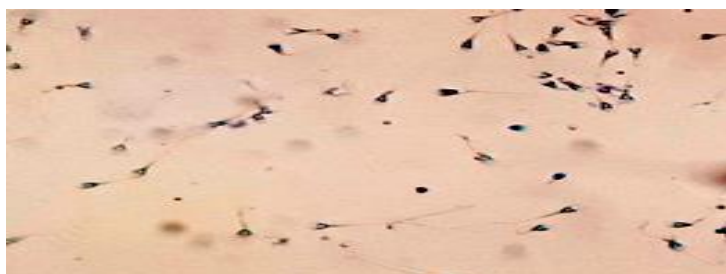
شکل ۲. رنگ آمیزی تولوئیدین بلو: آبی روشن (کروماتین طبیعی) ۱: آبی تیره (کروماتین غیرطبیعی به صورت خفیف) ۲: بنفش و ارغوانی (کروماتین شدیداً غیرطبیعی). (میکروسکوپ نوری، بزرگ نمایی ۱۰۰۰×).

بررسی آسیب کروماتین اسپرم با رنگ آمیزی تولوئیدین بلو (TB) Toluidine Blue : در این روش رنگ آمیزی، کیفیت و کمیت تراکم کروماتین هسته ی اسپرم رامشخص می کند. اسمیرهای اسپرم تهیه شده را با محلول اتانول ۹۶٪ واستون تازه به نسبت ۱:۱ در دمای ۴ درجه ی سانتی گراد به مدت ۳۰ دقیقه فیکس کرده و به مدت ۵ دقیقه در دمای ۴ درجه ی سانتی گراد در محلول ۰/۱ نرمال هیدروکلریک اسید انکوبه کردیم. اسلاید ها به مدت ۲ دقیقه و ۳ مرتبه با آب مقطر شسته شد و نهایتا در محلول تولوئیدین بلو ۰/۰۵٪