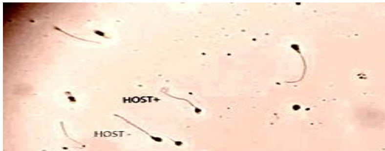
شکل ۳. رنگ آمیزی HOST. اسپرم های با دم پیچ خورده، دارای غشا سالم (HOST+) و اسپرم های با دم صاف دارای غشا ناسالم (HOST-). (میکروسکوپ نوری، بزرگ نمایی ۱۰۰۰×).

مدت ۳۰ دقیقه قرار دادیم. سپس ۱۰ میکرولیتر از مخلوط تهیه شده روی یک لام قرارداده و سپس روی آن لامل گذاشتیم. با استفاده از میکروسکوپ نوری با بزرگنمایی عدسی شیئی ۱۰۰ از هر نمونه حداقل ۲۰۰ اسپرما توزوآ شمارش شدند و درصد اسپرم های متورم با دم پیچ خورده محاسبه شد. در این روش اسپرم های زنده با غشا سالم، دم پیچ خورده و متورم و اسپرم ها با غشای سلولی تخریب شده، دم صاف و متورم نشده مشاهده شدند (۲۴) (شکل ۳).