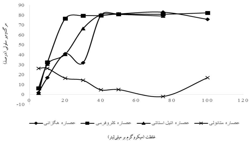
شکل ۱. درصد مرگ‌ومیر سلولی پس از اثر ۴۸ ساعت عصاره‌های هگزانی، کلروفومی، ایتیل استاتی و متانولی اندام هوایی مینای نیشابوری ( S. platyrachis ) بر روی رده سلولی MCF-7