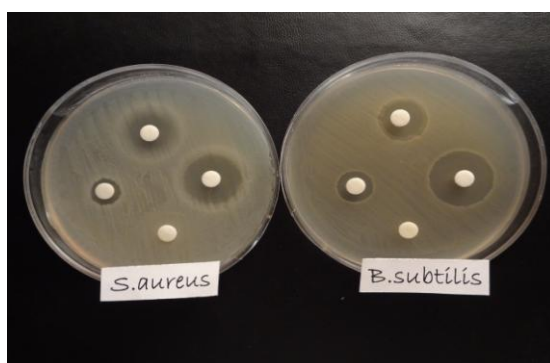
شکل ۲: تاثیر غلظت‌های مختلف دندریمر PAMAM-G4 بر تشکیل هاله عدم رشد در باکتری‌های گرم مثبت

جدول ۴ نتایج حداقل غلظت بازدارندگی و حداقل غلظت کشندگی دندریمر پلی‌آمیدوآمین نسل ۴ را بر روی باکتری‌های مورد مطالعه نمایش می‌دهد. همانطور که