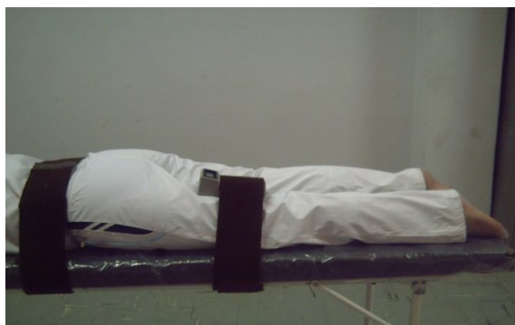
شکل 2. اندازه‌گیری قدرت ایزومتریک اکستنسور ران

در مورد اندازه‌گیری و تکمیل آن نیز به آزمودنی‌ها توضیحات لازم داده شد. پس از جمع‌آوری مشخصات فردی آزمودنی‌ها، برای گردآوری اطلاعات خام آزمودنی‌ها مانند قد، وزن، از قدسنج، ترازوی دیجیتال، و قدرت عضلات ابداکتور و اکستنسور ران به کمک دینامومتر دستی مدل نیکلاس (01160) در پای آسیب دیده و سالم آزمودنی‌ها اندازه‌گیری شدند. لازم به ذکر است که برای ارزیابی تکرارپذیری و اعتبارسنجی قدرت ایزومتریک عضلات ابداکتور و اکستنسور ران، 6 نفر آزمودنی سالم به طور تصادفی انتخاب شدند و در دو روز مختلف 2 بار از آنها اندازه‌گیری به عمل آمد و میزان تکرارپذیری آزمون قدرت ایزومتریک عضلات ابداکتور ( ICC^1: 0/84 ) و آزمون قدرت ایزومتریک عضلات اکستنسور ( ICC: 0/85 ) بدست آمد.