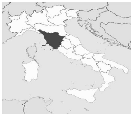
تصویر ۲: محل جغرافیایی منطقه تاسکانی در ایتالیا (منطقه تیره رنگ)

قابل توجه است زیرا لجن تجاری فانگو از منطقه تاسکانی ۹ کشور ایتالیا (ناحیه تیره رنگ در نقشه) استخراج و تهیه می گردد که یک منطقه جنگلی در حاشیه دریای مدیترانه است که از محتوای نمکی بسیار کمتری در مقایسه با دریاچه برخوردار می باشد.