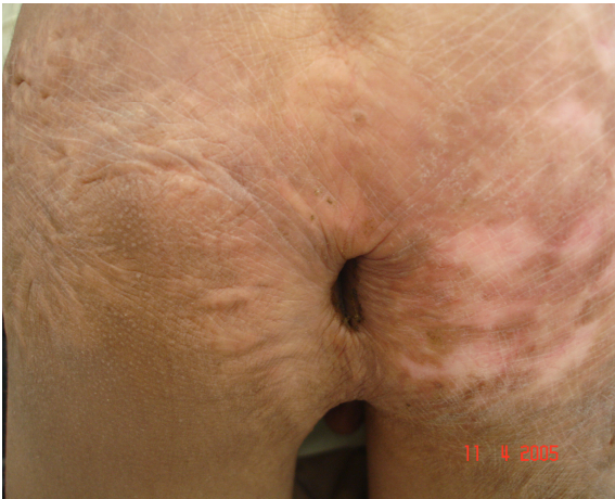
تصویر ۲: نشانه‌دهنده اسکار وسیع که سبب بی‌اختیاری مدفوع و نشت مقداری مدفوع به خارج شده بود.

یک پسر ۱۲ ساله افغانی به علت بی‌اختیاری ادراری به کلینیک مراجعه کرد. بیمار در شش ماهگی هنگام بازی در اثر افتادن در تنور دچار سوختگی هر دو پا، ساق، ران، باسن و ناحیه پرینه با میزان تقریبی ۲۸٪ سطح بدن می‌شود که بدون درمان جراحی و با پانسمان مکرر درمان می‌شود. تا آنجایی که خود او و والدینش به یاد دارند او هیچوقت کنترل مدفوع را بدست نیاورد. در معاینه کلینیکی اسکار وسیع در پرینه با توسعه به باسن در دو طرف وجود داشت که باعث بسته‌شدن شکاف گلوئتال شده بود (عکس ۱).