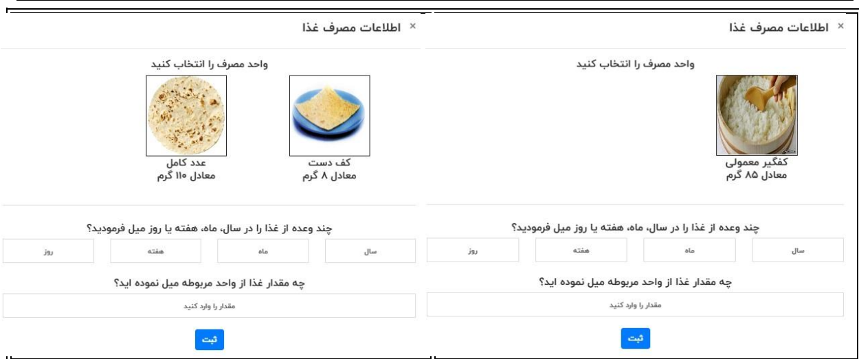
شکل ۴: تعیین نحوه و سهم مصرفی هر ماده غذایی در سامانه ترکیبات مواد غذایی ایران

پرسشنامه یادآمد همان‌طور که قبلاً گفته شد با انتخاب گزینه یادآمد می‌توان هر تعداد که لازم است یادآمد ۲۴ ساعته برای هر کاربر به تفکیک تاریخ تکمیل کرد. برای این منظور ابتدا کد ملی و کد طرح مربوطه را وارد کرده، آنگاه تاریخ مورد نظر را انتخاب نموده و سپس نام ماده غذایی را در کادر جستجو