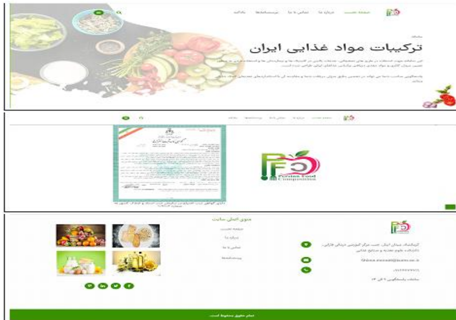
شکل ۱: نمای صفحه اصلی سامانه ترکیبات مواد غذایی ایران

یافته‌های مطالعه حاضر منجر به طراحی سامانه ترکیبات مواد غذایی ایران به آدرس https://persianfc.ir شد که