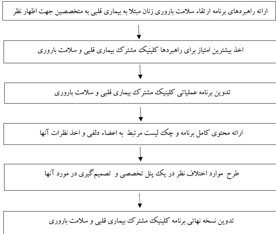
نمودار ۱: الگوریتم اجرای دلفی