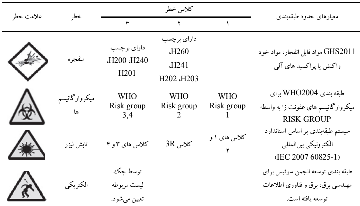
جدول ۱. خطرات موجود در روش ACHIL

سه سطح قرار می‌گیرند. مقادیر حدود مجاز توسط الزامات جهانی سازمان ملل متحد و آژانس بین‌المللی تحقیقات سرطان و غیره ویرایش شده است (جدول ۱). در این روش جهت طبقه‌بندی خطرات الکتریکی از پرسشنامه انجمن ایمنی سوئیس استفاده گردید. در این پرسشنامه تجهیزات با خطرات الکتریکی در دو گروه عمده تجهیزات الکتریکی و تجهیزات