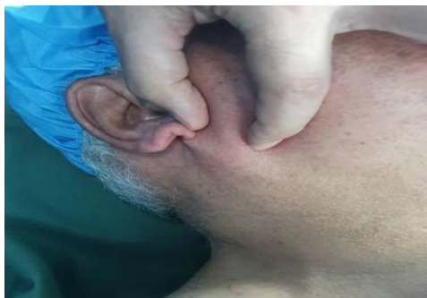
شکل ۱. توده غده پاروتید راست

مشخص و کانون تغییرات میکروسیتی و کراتینه شدن مرکزی مشهود بود. فعالیت میتوزی قابل توجهی و نکروز لنفادنوم سباسبه بود.