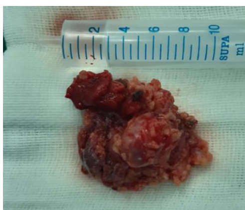
شکل ۳. بافت غده پاروتید همراه با توده با حدود مشخص، به رنگ زرد