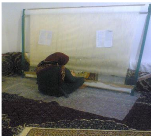
شکل ۳- نمونه دارقالی و پوسچر کاری در زنان قالیباف شهر سنندج

برای بافتن آن باید نیروی زیادی صرف کند، اما در مطالعه‌ی ما دارهای مورد استفاده اغلب کوچکتر و سبکتر از دارهای سنتی بودند، اما در نوع پوسچر اتخاذ شده تفاوت زیادی نبود. نمونه دارقالی و پوسچر کاری در شکل ۳ نشان داده شده است.