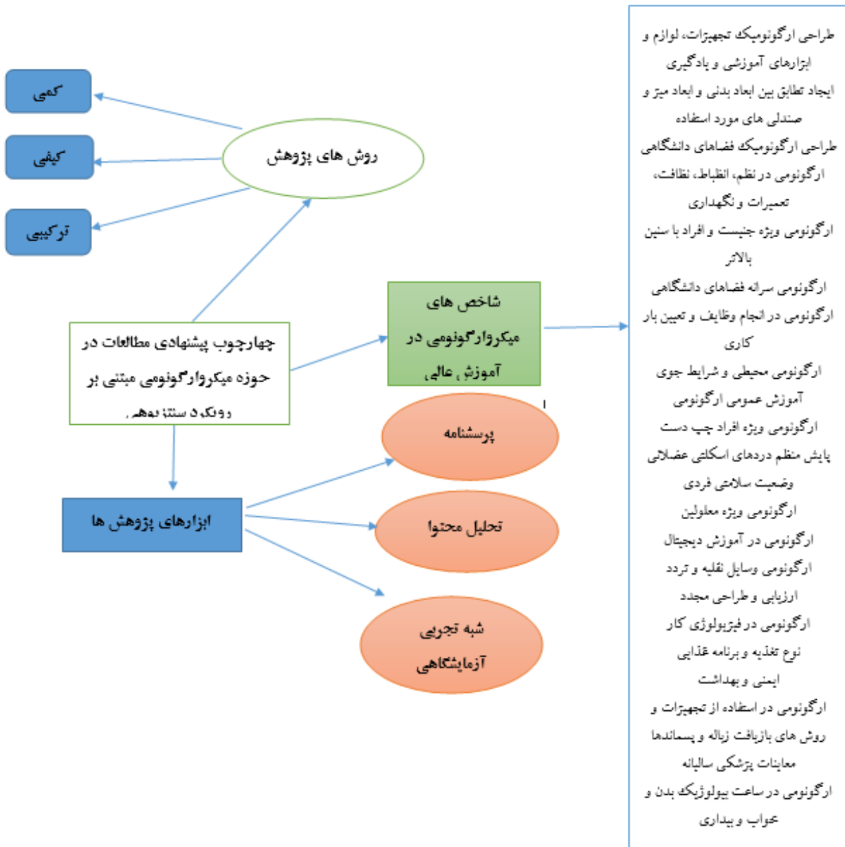
شکل ۱. روش‌های پژوهش در مطالعات مرتبط با میکرو ارگونومی در آموزش عالی

انجام مطالعات مرتبط با میکرو ارگونومی در آموزش عالی می‌توان از پرسش‌نامه و مصاحبه، تحلیل محتوا، شبه تجربی و آزمایشگاهی اسم برد که این نتایج در شکل ۱ آمده است.