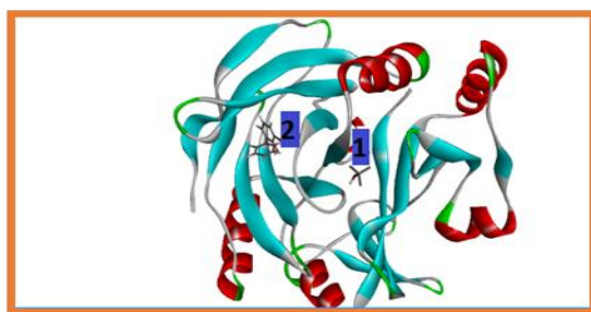
شکل ۳. کمپلکس DHBD-DHB. کمپلکس DHBD-DHB با مهار کننده در نرم‌افزار Discovery (۱-T-Butanol-۲-لیگاند DHB)

نتایج (شکل ۳) نشان داد در موقعیت‌های مختلف، مهار کننده می‌تواند، رفتارهای متفاوتی در آنزیم ایجاد کند. بهترین موقعیت مهار کننده بر اساس کم‌ترین تاثیر در برهم‌کنش بین آنزیم و ماده اولیه انتخاب شد. پس از مشخص کردن بهترین موقعیت قرار گیری مهار کننده حاصل از بررسی داکینگ، برای مقایسه موقعیت داک شده و آنزیم اصلی همراه با مهار کننده (موجود در ساختار KNF1)، از نرم‌افزار Chimera استفاده گردید. از نرم افزار Chimera برای بر روی هم قرار دادن ترکیب پروتئین-مهار کننده از