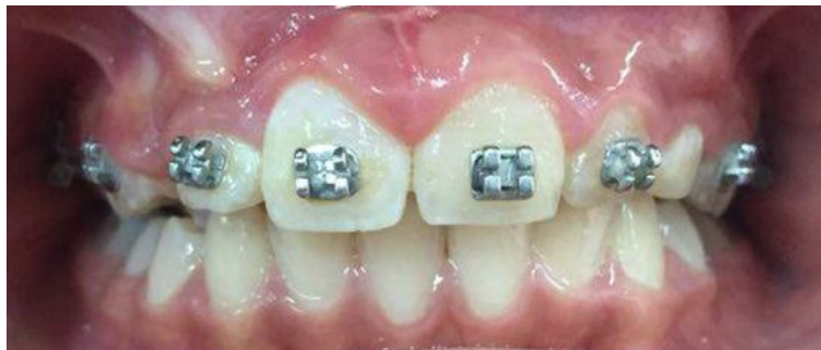
تصویر ۸: تصویر داخل دهانی بیمار بعد از جراحی لثه

مورفولوژی ریشه یک منحنی L شکل را نشان می دهد و نهفتگی های سمت پالاتال حاوی یک انحنای پیوسته C شکل در ریشه هستند؛ اما در بیمار مطالعه ما در ریشه دندان نهفته هیچ انحنایی مشاهده نشد (۱۲).