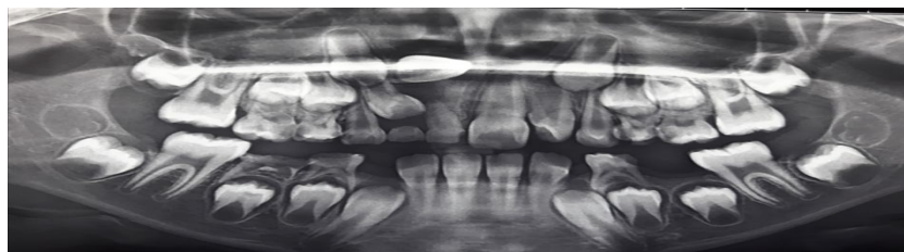
تصویر ۲: تصویر پانورامیک دندان نهفته سانترال راست فک بالا

کودک نسبت‌های صورتی متعادلی داشت؛ اما به دلیل مشکل در ناحیه قدامی، زیبایی لبخند مختل شده بود. رابطه مولرها در سمت Class I بود. در لمس قدام فک بالا یک برآمدگی بدون درد، سفت و متراکم در سمت راست فرنوم لبی احساس شد. هیچ سابقه پزشکی یا خانوادگی مرتبطی وجود نداشت، همچنین سابقه ضربه به ناحیه دهان نیز رد شد. در مورد