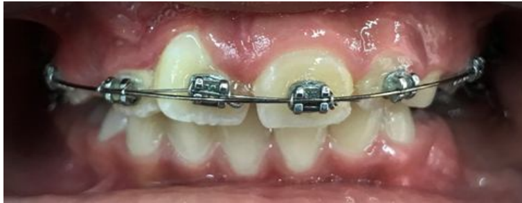
تصویر ۷: نمای بالینی حین درمان ارتودنسی ثابت