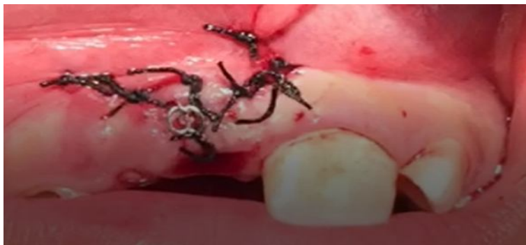
تصویر ۵: نمای بالینی بیمار پس از اتمام جراحی به روش بسته

بود (تصویر ۶). درمان ارتودنسی ثابت برای تراز کردن دندان‌های او انجام شد (تصویر ۷). در طی پروسه درمان ارتودنسی، مارژین لثه دندان‌های سانترال فک بالا هم سطح نبودند و نیاز بود که برای بیمار جراحی لثه انجام شود (تصویر ۸). نهایتاً پس از انجام درمان‌های بین‌رشته‌ای کودکان، جراحی، ارتودنسی و پریدنتولوژی درمان به اتمام رسید.