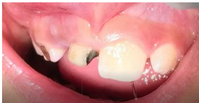
تصویر ۱: نمای بالینی بیمار و عدم رویش دندان‌های دائمی سنترال و لترال فک بالا

و رویکرد بین‌رشته‌ای است. درمان موفقیت‌آمیز سانترال‌های آسیب دیده می‌تواند به دلیل انکیلوز، از دست دادن چسبندگی، تحلیل ریشه خارجی و بیرون زدن ریشه پس از درمان ارتودنسی چالش برانگیز باشد. همچنین نهفتگی دندان‌های می‌تواند عوارض جدی مانند عدم رویش دندان مذکور، موقعیت‌های نا به جا دندان‌های مجاور، جابجایی کامل (ترنسپوزیشن) انسیزور‌ها، از دست رفتن فضا و ناهماهنگی میدلاین، دندان‌های نامنظم و تحلیل ریشه دندان‌های مجاور را در پی داشته باشد (۱۱). با توجه به دلایل ذکر شده جهت لزوم درمان دندان نهفته، روند درمان بیمار