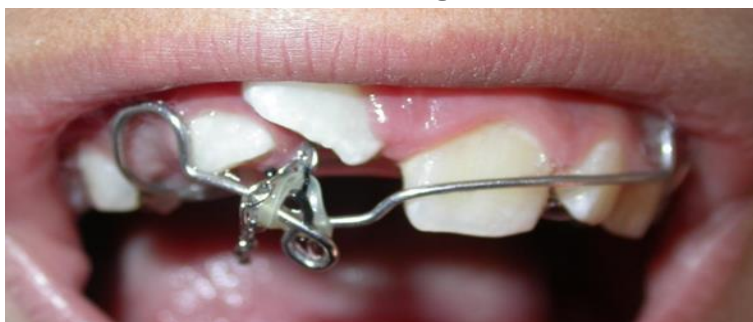
تصویر ۶: نمای داخل دهانی بیمار که رویش اندک دندان را نشان می‌دهد

حین عمل جراحی یک زنجیر ارتودنسی به تکمه سمت پالاتال دندان نهفته متصل شد. در جلسه بعدی زنجیر ارتودنسی به وسیله یک الاستیک یک هشتم به LOOP تعبیه شده در لبیال بو ناحیه دندان نهفته به پلاک متحرک بیمار متصل شد، به این ترتیب دندان نهفته با اعمال نیروی سبک ارتودنسی به محیط دهان وارد شد. دندان سانترال نهفته پس از گذشت حدود یک ماه به اندازه کافی به داخل حفره دهان بیرون آمد؛ اما جهت‌گیری دندان به سمت دیستال و نیازمند اصلاح