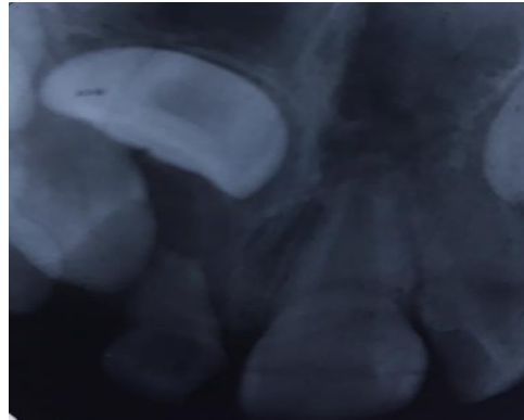
تصویر ۳: تصویر پری اپیکال دندان نهفته سانترال راست در فک بالا