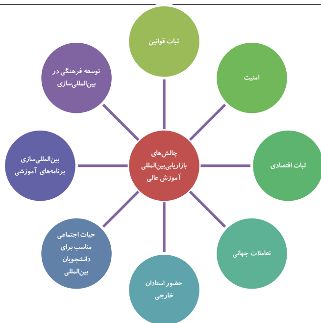
شکل ۴: پیش‌ران‌های بازاریابی بین‌المللی آموزش در دانشگاه علوم پزشکی تهران