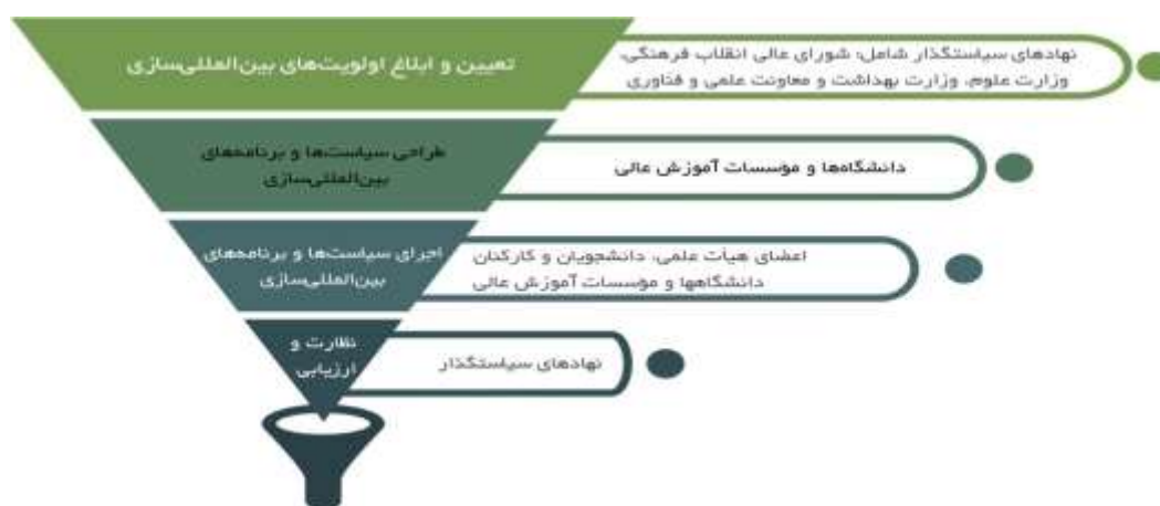
شکل ۱: سیاست گذاری آموزش عالی بین المللی از بالا به پایین

ایده اصلی فرایند از پایین به بالا آن بود که دستیابی به آینده مطلوب دانشگاه در بازاریابی بین المللی مستلزم شکل گیری