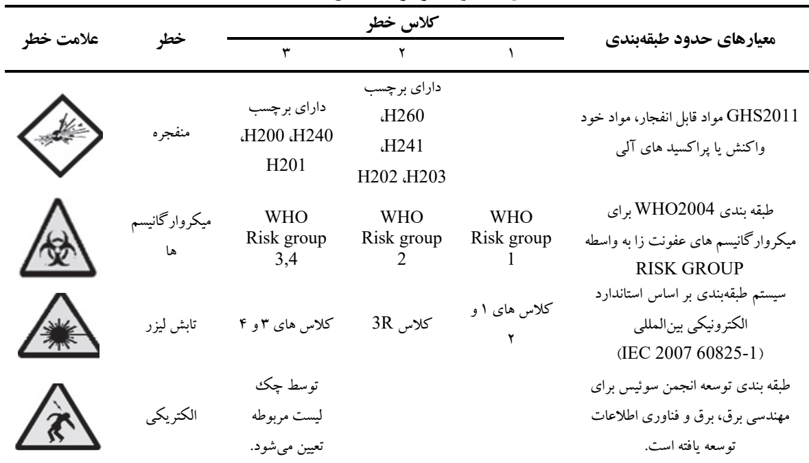
جدول ۱. خطرات موجود در روش ACHIL

سه سطح قرار می‌گیرند. مقادیر حدود مجاز توسط الزامات جهانی سازمان ملل متحد و آژانس بین‌المللی تحقیقات سرطان و غیره ویرایش شده است (جدول ۱). در این روش جهت طبقه‌بندی خطرات الکتریکی از پرسشنامه انجمن ایمنی سوئیس استفاده گردید. در این پرسشنامه تجهیزات با خطرات الکتریکی در دو گروه عمده تجهیزات الکتریکی و تجهیزات