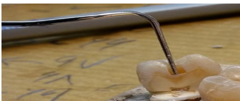
شکل ۲. اندازه گیری عمق پوسیدگی توسط پروب پرودنتال

کد ۴: سایه تیره عاج زیرین، با/بدون شکستگی