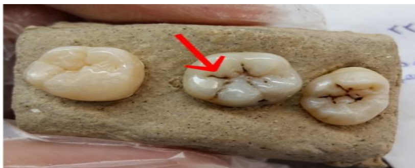
شکل ۱. نشانه گذاری شیار مورد نظر