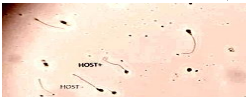
شکل ۳. رنگ آمیزی HOST. اسپرم های با دم پیچ خورده، دارای غشا سالم (HOST+) و اسپرم های با دم صاف دارای غشا ناسالم (HOST-). (میکروسکوپ نوری، بزرگ نمایی ۱۰۰۰×).

مدت ۳۰ دقیقه قرار دادیم. سپس ۱۰ میکرولیتر از مخلوط تهیه شده روی یک لام قرارداده و سپس روی آن لامل گذاشتیم. با استفاده از میکروسکوپ نوری با بزرگنمایی عدسی شیئی ۱۰۰ از هر نمونه حداقل ۲۰۰ اسپرما توزوآ شمارش شدند و درصد اسپرم های متورم با دم پیچ خورده محاسبه شد. در این روش اسپرم های زنده با غشا سالم، دم پیچ خورده و متورم و اسپرم ها با غشای سلولی تخریب شده، دم صاف و متورم نشده مشاهده شدند (۲۴) (شکل ۳).