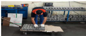
تصویر ۳. گذاشتن میل سوپاپ در داخل سرسیلندر در زیر وظیفه تست و کیوم