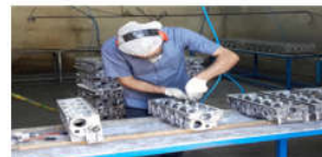
تصویر ۲. تخلیه بعد از شستشو در زیروظیفه شستشو