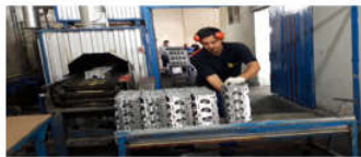
تصویر ۱. عملیات فرزنی در زیروظیفه پلیسه‌گیری

نمونه‌ای از وضعیت بدن کارگران در ایستگاه کار در تصاویر ۱ تا ۴ ارائه شده است.