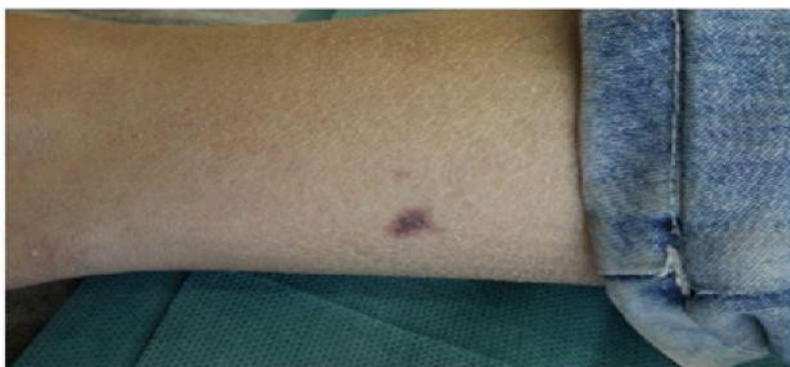
شکل ۱: پاپول قرمز تیره احاطه شده توسط هاله به رنگ قهوه ای تیره در ناحیه تحتانی ساق پا

فیبرینی در عروق سطحی درم وجود داشت (شکل های ۳ و ۴). با توجه به مشخصات کلینیکی و آسیب شناسی تشخیص Hobnail hemangioma برای بیمار مطرح شد. در پیگیری انجام شده هاله اکیموتیک بعد از چندین ماه ناپدید شد و ضایعه پس از گذشت ۳ سال عود نداشت.