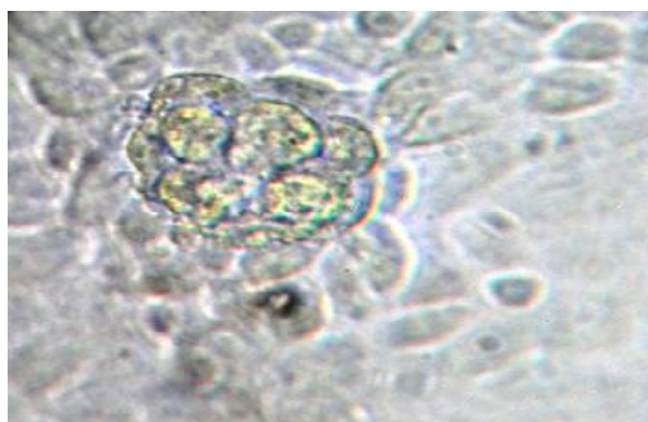
شکل ۱- کلونی تمشکی شکل اسپرماتوگونی در روز دهم کشت (بزرگنمایی: ۱۰۰۰X).

ابتدا داده‌های جمع آوری شده از لحاظ نرمال بودن ارزیابی شدند. پس از نرمال کردن داده‌ها آزمون آنالیز واریانس انجام شده و اثرات متقابل غلظت‌های مختلف ویتامین ث و طول مدت کشت بر تعداد و مساحت کلونی با استفاده از