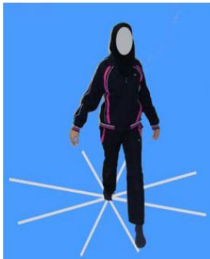
شکل ۲. تست تعادلی ستاره برای اندازه گیری کنترل پوسچر دینامیک (جهت قدمی)

ترسیم شده توسط محقق قرار داده و با پای دیگر عمل دستیابی را برای هر جهت انجام می داد (شکل ۲) و به حالت طبیعی روی دو پا برمی گشت. آزمودنی ها هر یک از جهت ها را ۳ بار انجام داده و بین هر بار ۳ ثانیه استراحت و بین هر پا نیز ۵ دقیقه استراحت می کردند، سپس میانگین فاصله دستیابی در سه بار تلاش محاسبه شده و بر حسب درصدی از طول پا برای هر یک از جهات ۸ گانه بیان می شد زیرا طول پای افراد بر فاصله دستیابی آنها اثر گذار است (۱۴). هر آزمودنی ۶ بار این آزمون را تمرین می کرد تا روش اجرای آزمون را فراگیرد. پای آسیب دیده آزمودنی تعیین