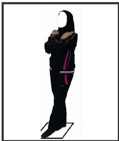
شکل ۱. آزمون شارپند رومبرگ برای اندازه‌گیری کنترل پوسچر استاتیک

برای برآورد توانایی کنترل پوسچر دینامیک آزمودنی‌ها از تست عملکرد تعادلی ستاره استفاده شد (۱۴). آزمون ستاره، آزمونی عملکردی است که از یک پای ایستا و بیشترین فاصله دستیابی با پای دیگر تشکیل شده است. این آزمون دارای هشت جهت است که با یکدیگر زاویه ۴۵ درجه می‌سازند. آزمونگر نحوه اجرای آزمون عملکردی ستاره ای را به طور کامل برای آزمودنی‌ها توضیح داد و خطاهایی را که ممکن است در طی آزمون توسط آزمودنی انجام شود را مطرح کرد. این خطاها عبارت بود از: پای اتکا از وسط شبکه ستاره‌ای برداشته شود، تعادل فرد در طول هر بار عمل دستیابی کم شود، وضعیت شروع و برگشت نتواند برای یک ثانیه کامل حفظ گردد، پای آزمودنی در هر نقطه روی خط تماس پیدا کند در حالی که وزن بدن روی پای اتکا تحمل می‌شود. پس از ارائه توضیحات لازم درخصوص نحوه اجرای تست بوسیله آزمونگر، آزمودنی‌ها ابتدا تمرینات کششی ویژه عضلات کوادریسپس، همسترینگ، گاستروکنمیوس و سولئوس را به مدت ۵ دقیقه انجام داد، سپس هر آزمودنی پای آسیب‌دیده خود را در مرکز ستاره