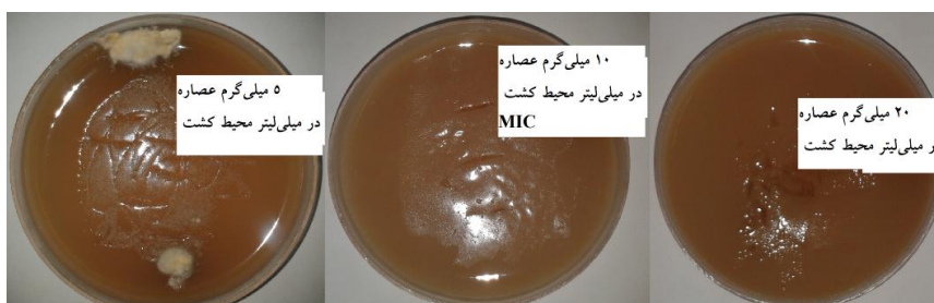
شکل ۲: اثرات ضدقارچی عصاره تام آبی گیاه آرمک کبیر علیه میکروسپوروم جیسیسوم در روش رقیق سازی در آگار