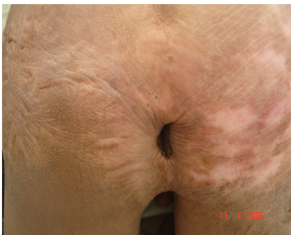
تصویر ۲: نشاندهنده اسکار وسیع که سبب بی‌اختیاری مدفوع و نشت مقداری مدفوع به خارج شده بود.

یک پسر ۱۲ ساله افغانی به علت بی‌اختیاری ادراری به کلینیک مراجعه کرد. بیمار در شش ماهگی هنگام بازی در اثر افتادن در تنور دچار سوختگی هر دو پا، ساق، ران، باسن و ناحیه پرینه با میزان تقریبی ۲۸٪ سطح بدن می‌شود که بدون درمان جراحی و با پانسمان مکرر درمان می‌شود. تا آنجایی که خود او و والدینش به یاد دارند او هیچوقت کنترل مدفوع را بدست نیاورد. در معاینه کلینیکی اسکار وسیع در پرینه با توسعه به باسن در دو طرف وجود داشت که باعث بسته‌شدن شکاف گلوئیتال شده بود (عکس ۱).