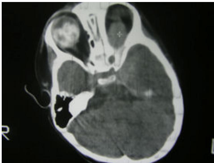
تصویر ۱: CT-Scan بدون تزریق مغز در CT-Scan تصویر ۱ وجود توده در اوربیت چپ و نیز وجود کلسیفیکاسیون داخل اوربیت خصوصاً در سمت راست مشهود است.

تشخیص نهایی با توجه به یافته‌های اختصاصی در CT-Scan بیمار و عدم وجود هیچگونه متاستاز در سایر نقاط بدن، پس از بررسی‌های انجام شده، Trilateral Retinoblastoma اعلام شد.