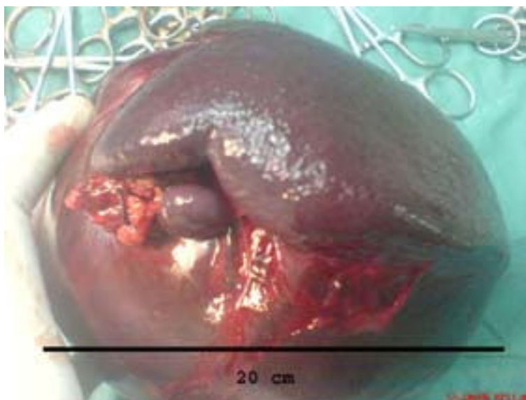
تصویر ۱: نمای طحال و کیست طحالی تصویر فوق نمای کیست طحالی را در قسمت تحتانی پارانشیم طحال با قطر ۲۰ cm نشان می دهد.