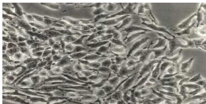
تصویر ۱: سلول های HeLa قبل از مجاورت با توکسین باکتری

مجاورت با توکسین باکتری پس از ۲۴ ساعت دچار تغییر دیواره سلولی شده و حدود ۱۱٪ از سلول ها از حالت دوکی بصورت گرد درآمدند که نشانه خاصیت سیتوتوکسیستی است (تصاویر ۱ و ۲). از سوش های توکسین زا ۴ تا شیگلا سونئی، ۴ تا شیگلا فلکسنری، یکی شیگلا دیسانتری است. سوش های شیگلا بوئیدی خاصیت توکسین زائی نداشتند.