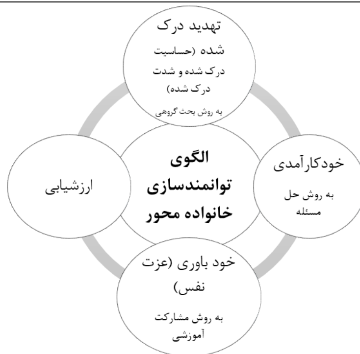
شکل ۲: مراحل الگوی توانمندسازی خانواده محور (۲۱)