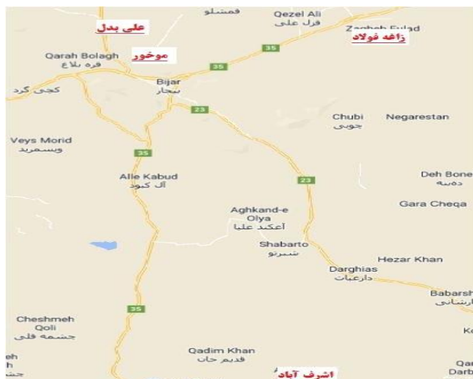
شکل ۱: موقعیت جغرافیایی مناطق مورد مطالعه

سپس، یک گرم از هر نمونه در کوره الکتریکی با درجه حرارت ۴۵۰ درجه سلیسیوس تا دستیابی به خاکستر سفید و بدون کربن قرار داده شدند. عصاره‌گیری از نمونه‌ها به روش هضم اسیدی و توسط اسید نیتریک ۴ مولار در حرارت ۹۵ درجه سلیسیوس انجام شد. برای تعیین فلزات سنگین در قسمت‌های مختلف گیاه گندم، ۱ گرم نمونه گندم در دمای ۵۰۰ درجه سلیسیوس به مدت ۱۲ ساعت خاکستر شده شدند (۲۲ و ۲۳). نمونه‌های گندم توسط HCl به مدت ۵ ساعت حرارت دیده و استخراج شد، سپس نمونه‌ها را با آب مقطر به حجم رسانده و جهت آنالیزهای بعدی ذخیره شدند.