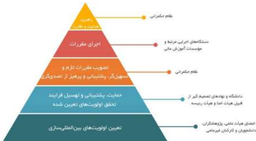
شکل ۲: سیاست‌گذاری آموزش عالی بین‌المللی از پایین به بالا