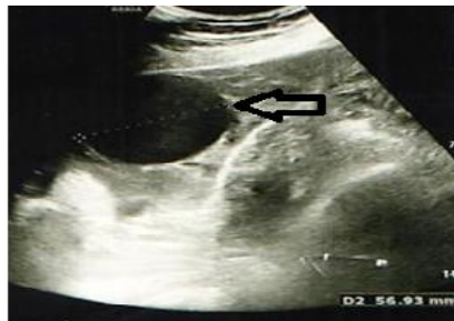
تصویر ۱. سونوگرافی ترانس واژینال. کیست تخمدان راست (فلش سفید)

زنده در رحم و ساک دیگر با جنین دارای قلب و سن بارداری ۷ هفته و ۶ روز در آدنکس راست و دو کیست ۳۷ و ۵۶ میلیمتری با جدار صاف در آدنکس راست به همراه مایع آزاد در شکم و لگن تا زیر هر دو دیافراگم گزارش گردید (تصاویر ۱ و ۲).