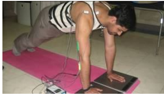
تصویر ۱: وضعیت شروع آزمون

به راست و چپ و یا فلکشن و یا اکستنشن نیز در ناحیه گردنی وجود نداشته باشد.