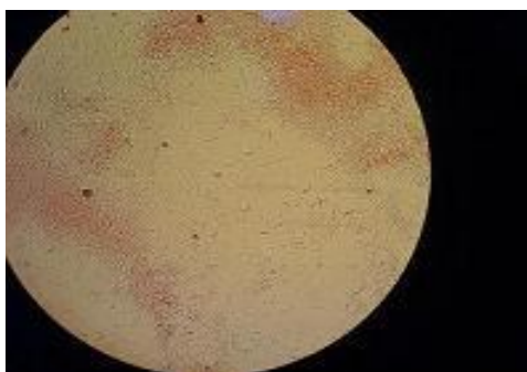
ب: رنگ آمیزی گرم لژیونلا پنوموفیلا