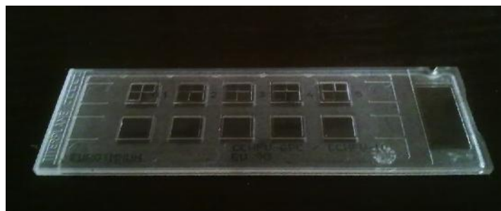
تصویر ۱: لام ایمنوفلورسنت با Biochip پوشیده با سلول های حاوی ویروس CCHF