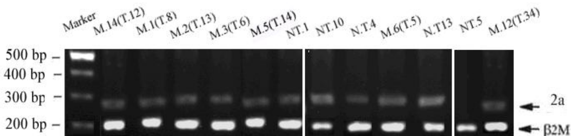
شکل ۲: الگوی الکتروفورز محصولات PCR ژن Survivin-2 \alpha و \beta 2m در نمونه‌های غیر توموری و حاشیه توموری. N.T.: غیر تومور. M.: حاشیه تومور